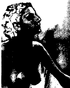
Man Ray, Galerie Artiscope