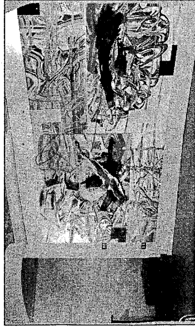
Alcune opere di Dell'Amico

triangolo raccoglie le diversità, mentre il cerchio, ad esempio, inscrive le unicità. Gli artisti propongono tre concezioni d'arte cosmologicamente differenti, pur essendo accomunati da medesime radici. Il perugino Dell'amico propone un'arte moderna digitalizzata. Descrive infatti nelle sue immense composizioni una realtà modernizzata oserei dire futuribile, che nel collage e nella aggiunta, dopo i primi passaggi digitali, plottizzati e scannerizzati, definisce, metaforicamente, un futuro incerto. Allumini alla base dell'opera,