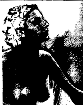
Man Ray, Galerie Artiscope

• La galerie Artiscope propose dès le 17 Septembre une "installation" des oeuvres de l'artiste Karpüseeler. Celui-ci travaille depuis les années 70 sur les rap-