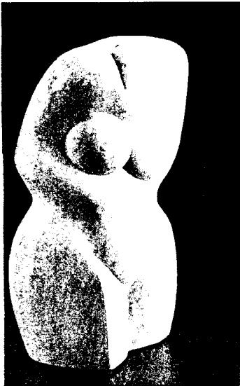
JEMASSIEUX, "Torso", marbre de Carrare, Galerie Albert I, j.29/9